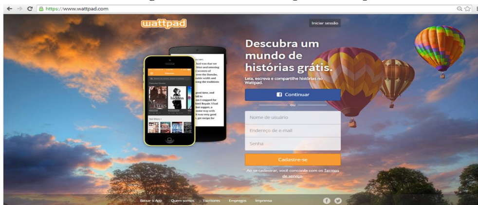
Figura 1 – Interface Principal do Wattpad

Ao acessar a plataforma principal (Figura 1), o usuário pode optar por se conectar através do Facebook ou criar uma conta não vinculada a outras redes sociais, fornecendo um nome de usuário, endereço de e-mail e senha. Se o usuário optar por se conecta com uma conta do Facebook , o site faz uma busca no seu histórico de amigos e oferece uma lista de usuários que já possuem uma conta no Wattpad. Essa opção possibilita uma interação melhor na plataforma, visto que um dos objetivos principais da mesma é que haja uma troca de informações entre usuários.