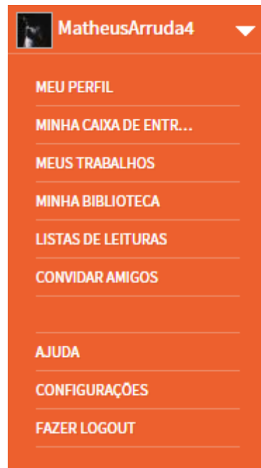
Figura 3 – Aba do Usuário