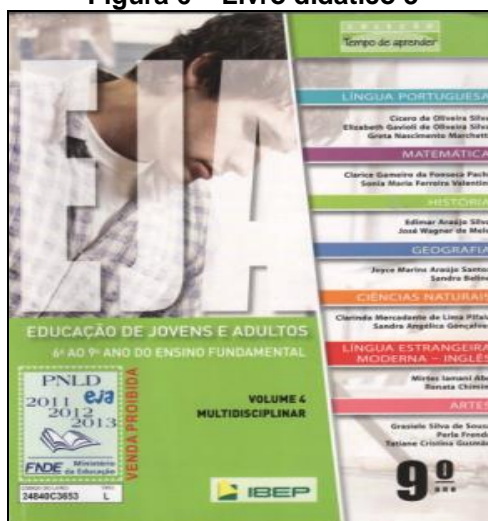
Figura 6 – Livro didático 3