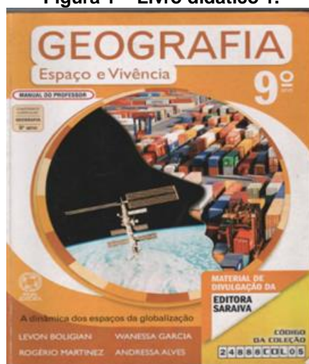
Figura 1 – Livro didático 1.