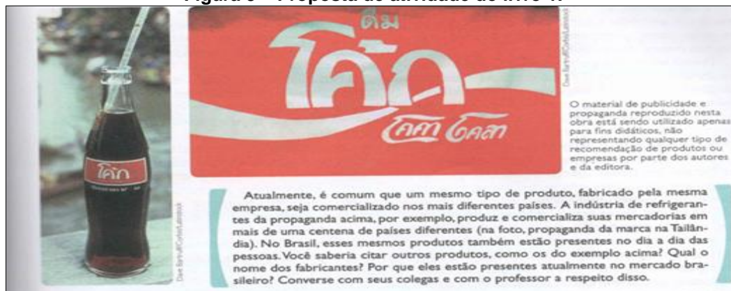
Figura 3 – Proposta de atividade do livro 1.