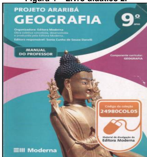
Figura 4 – Livro didático 2.