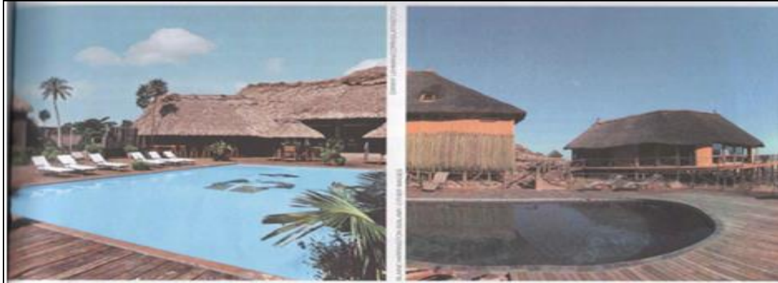
Figura 5 – Os resorts

encontre posicionada na parte dissertativa sobre a indústria cultural, indústria do lazer e da moda, teorizado pelo filósofo Adorno (HORKHEIMER, 1980).